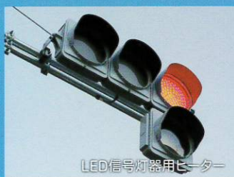
LED信号灯器用ヒーター